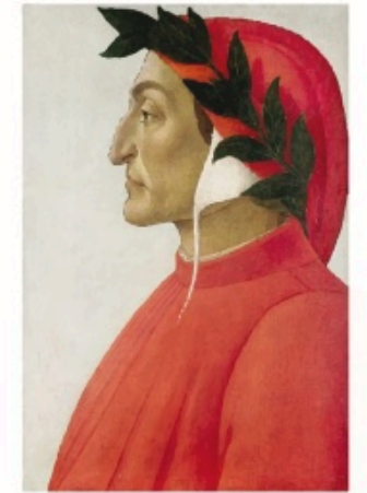
Figura 1 - Ritratto di Dante

Dante Alighieri fu un grande poeta italiano , nato a Firenze nel 1265 e morto a Ravenna nel 1321 .