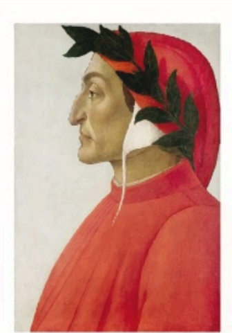
Figura 1 - Ritratto di Dante

Dante Alighieri fu un grande poeta italiano , nato a Firenze nel 1265 e morto a Ravenna nel 1321 .